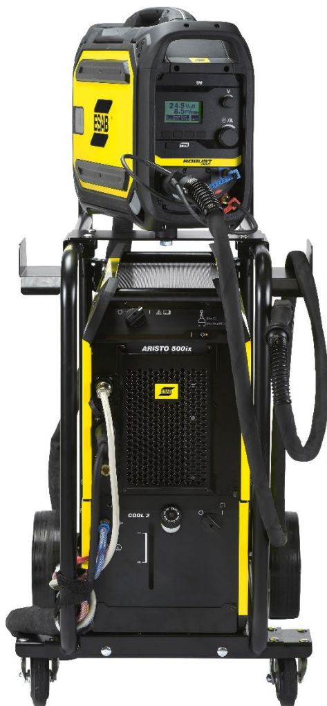
Aristo 500ix a Robust Feed U6

Aristo 500ix je přenosný zdroj pro pulzní svařování v těžkém průmyslu s robustním designem a mechanikou, na nějž se můžete spolehnout. Společně s podavači Robust Feed U6 a Pulse je dokonalým řešením pro náročné aplikace s pulzním svařováním.